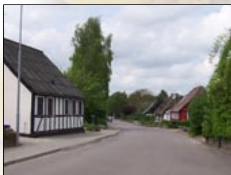
Der er mange gamle og velrenoverede huse i Søvind

Søvind har meget at byde på for den naturelskende familie.