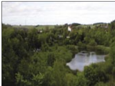
Natursti omkring den gamle mergelgrav. Borde og bænke i det fri. Længde 900 m