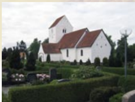
Den smukke, gamle kirke